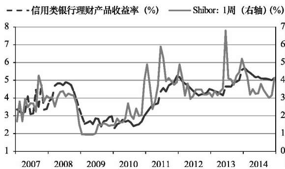
图3 信用类银行理财产品收益率和Shibor: 1周(2007~2014年)

从量的关系上看，银行理财产品与货币市场已经完成大部分的对接。从价的关系上看，使用本文的数据库略加处理，可以用上文确定年份维度的方法将信用类银行理财产品的时间区间从年细化到月，在月度上平均其收益率；同时，以从全国银行间同业拆借中心获取的Shibor期限为1周的数据作为代表，并将其进行月度平均，进而考察信用类银行理财产品收益率与货币市场利率之间的关系。从图3中可以发现，二者的变动高度一致，定量计算表明它们的相关性高达75.5%。 ① 再结合盛方富(2013) ② 就两者之间的因果关系所做的实证研究结论，可以得出信用类银行理财产品几乎是以货币市场利率为定价基准的结论。